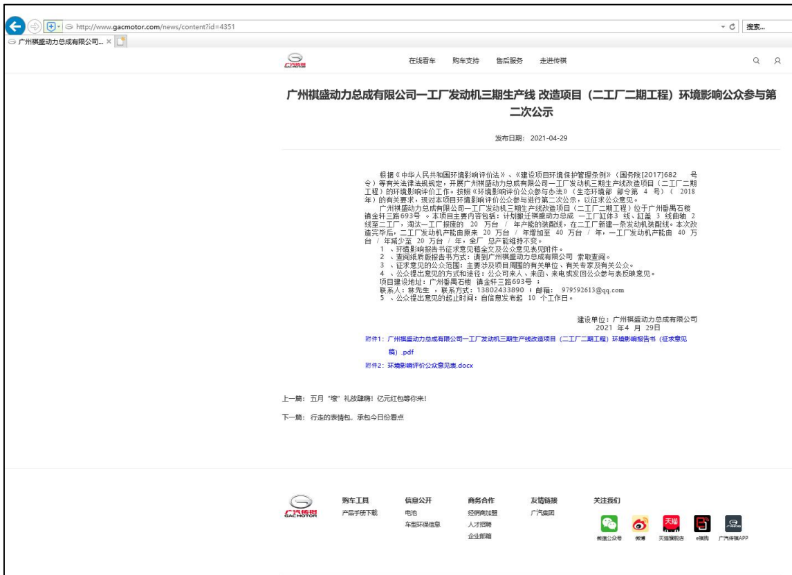
图 5.2-1 征求意见稿网上公示