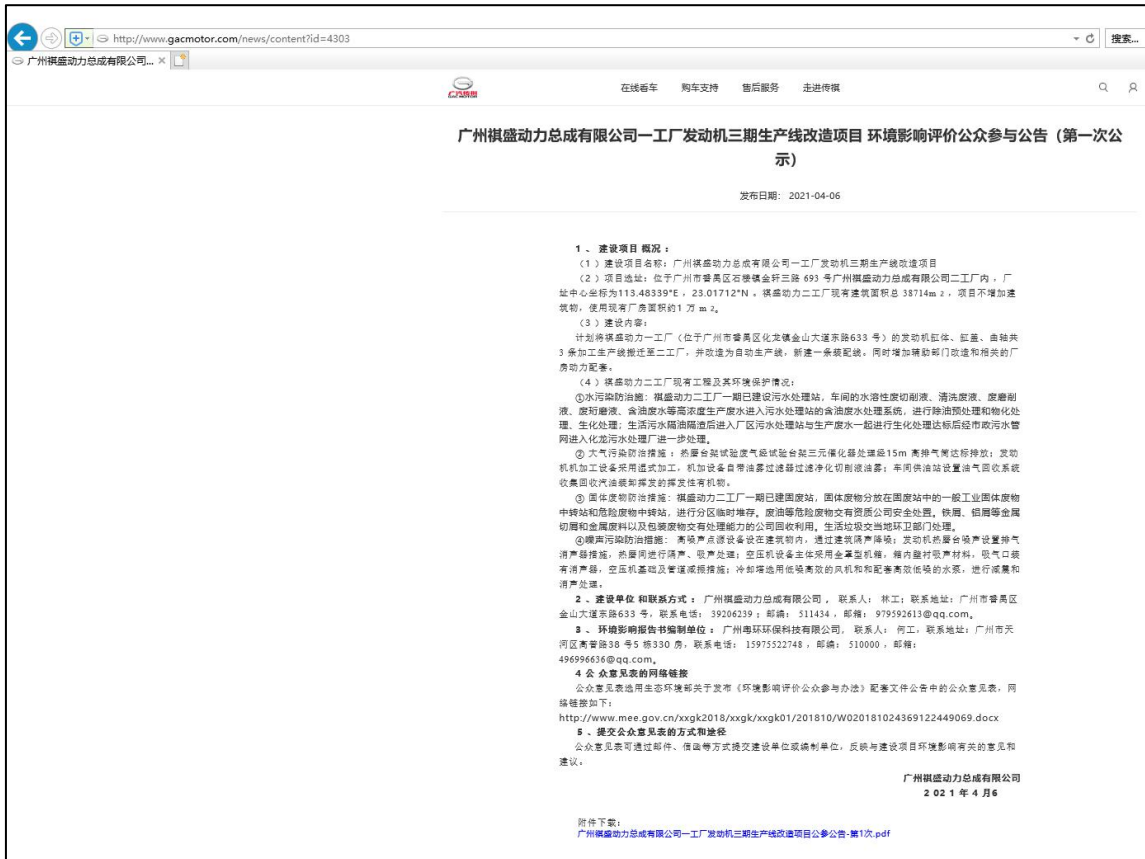
图 4.1-1 本项目首次环境影响评价信息公示